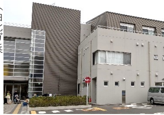
(由比ガ浜 こどもセンター)