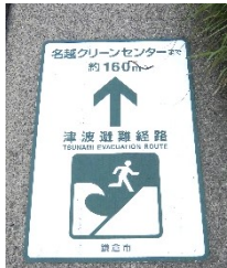
(避難経路を示す 路面シート)